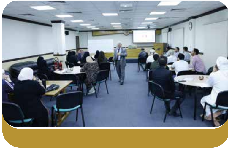
أثناء تقديم الدورة

أقيمت في السادس من فبراير ٢٠٢٤، في مقرّ مركز جمعة الماجد للثقافة والتراث بدبي، الدورة التأهيلية الثامنة عشرة في علم المكتبات والمعلومات، والتي استمرت حتى الخامس عشر من نفس الشهر، بمشاركة (٣٠) مشاركاً ومشاركة من مختلف المؤسسات الحكومية والخاصة في الدولة وخارجها.