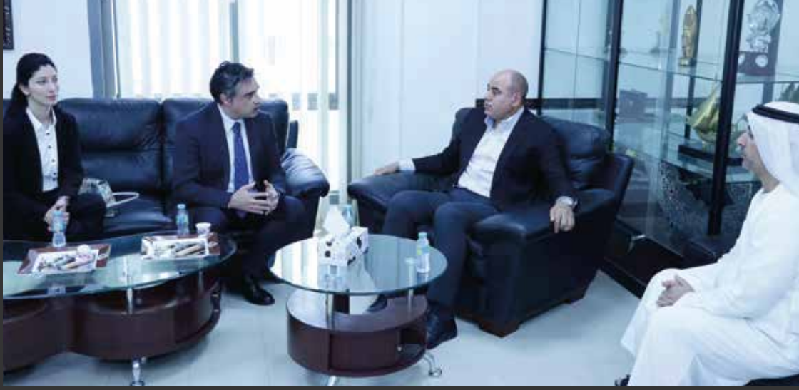
لقاء مدير عام المركز مع وفد المعهد

زار وفد من معهد الدراسات العلمية المتقدمة والتعاون في روما، برئاسة البروفيسور غابرييل أندريولي، رئيس المعهد، والسيدة أرتا فيتا، المؤسس المشارك والمدير التنفيذي للمعهد، مركز جمعة الماجد للثقافة والتراث بدبي يوم الثلاثاء ٢١ مايو ٢٠٢٤. هدفت الزيارة إلى الاطلاع على تجربة مركز جمعة الماجد ومعاينة الدور الذي يقوم به في خدمة الثقافة والتراث العالمي، بالإضافة إلى بحث مجالات التعاون المشتركة بين الجهتين.