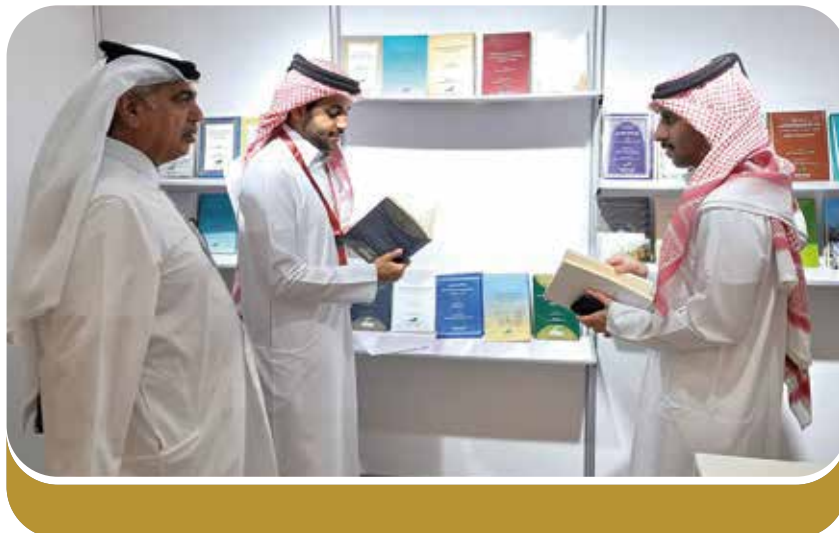
زوار جناح المعرض

شارك مركز جمعة الماجد للثقافة والتراث بدبي في فعاليات معرض جامعة قطر للكتاب، الذي نظّمته دار نشر جامعة قطر بالتعاون مع وزارة الثقافة القطرية في مقرّها بالدوحة، وذلك خلال الفترة من ٢٨ يناير حتى الأول من شهر فبراير. وتعدّ هذه المشاركة تلبيةً للدعوة التي تلقّاها المركز من قبل دار نشر جامعة قطر، وبمناخ فرصة كبيرة يلتقي فيها المركز بجمهوره في دولة قطر من الباحثين وطلاب الدراسات العليا في الجامعات، كما تسهم هذه المشاركة في التعريف بالمركز وإصداراته المتميزة، ودوره في مجال حفظ المخطوطات وتوفير المصادر والمراجع وخصوصاً النادرة منها. وقد افتتح المعرض الدكتورة مريم المعاضيد، نائب رئيس جامعة قطر للبحث والدراسات العليا، والتي قالت: "إن تنظيم هذا المعرض يشكل جزءاً مهماً من رؤية الجامعة ورسالتها وأهدافها، حيث يأتي تنظيم الحدث رغبة من الجهتين: وزارة الثقافة وجامعة قطر، في دعم التعليم ونشر الثقافة بين أفراد المجتمع بكل السبل المتاحة". وتشهد هذه الدورة مشاركة (٢٩) من دُور النشر والمراكز القطرية، منها: وزارة الأوقاف، وجائزة الشيخ حمد للترجمة والتفاهم الدولي، ودار الوثائق القطرية، ودار كتارا للنشر، ودار روزا للنشر، ودار نبج، بالإضافة إلى مشاركة من الجامعات ومراكز البحوث والنشر العربية من دول المغرب والإمارات والسعودية والكويت وسلطنة عمان.