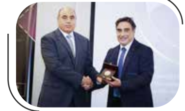
معهد الدراسات العلمية في روما يكرم المركز ٥