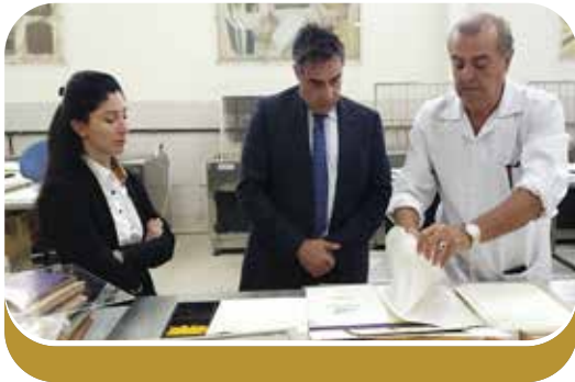
وفد معهد الدراسات العلمية المتقدمة والتعاون في روما يزور معمل الترميم ٢٠٢٤-٥-٢١