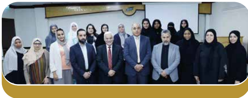
صورة جماعية مع المشاركين في الدورة

وقد شكر المشاركون المركز على إتاحة الفرصة لهم للمشاركة في الدورة التي تهدف إلى تدريب العاملين في المكتبات على البرامج والعلوم المستخدمة في فهرسة الكتب المطبوعة.