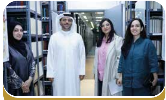
وفد من مؤسسة الشارقة للفنون ٢٠٢٤-٦-٤