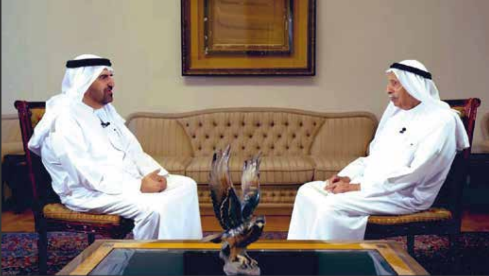
الإعلامي جمال بن حويرب يحاور جمعة الماجد

استضاف برنامج الرّأوي في موسمهِ الرابع عشر، الذي يُبثُّ يوميًا على قناة دبي الأولى خلال شهر رمضان المبارك، معالي جمعة الماجد، رئيس مركز جمعة الماجد للثقافة والتراث بدبي، وذلك لكونه من الشخصيات العامة المؤثرة في الدولة والمنطقة العربية والعالم.