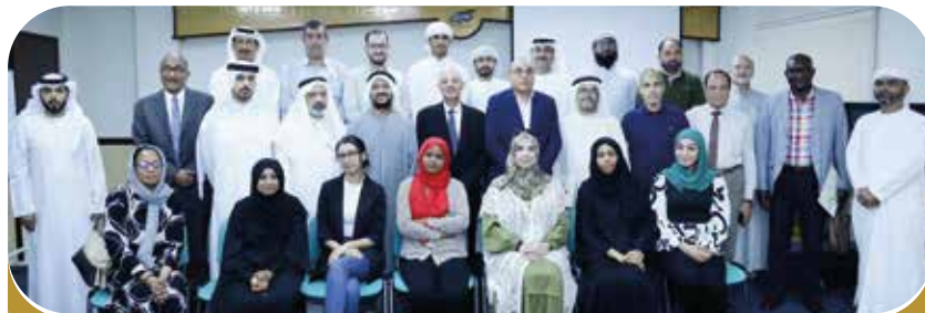
صورة مع المشاركين في الورشة