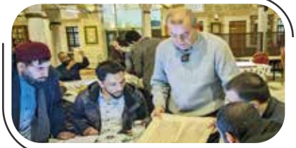
دورة دولية في ترميم المخطوطات بإستانبول ٨