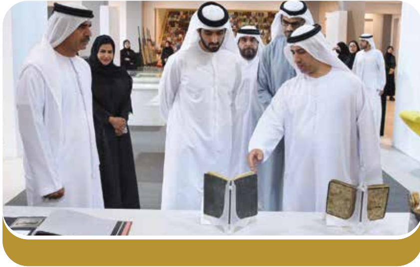
الشيخ عبد الله بن سعود المعلا يزور معرض المركز

افتتح الشيخ عبد الله بن سعود بن راشد المعلا، رئيس دائرة المالية بأم القيوين، يوم الثلاثاء 5 مارس 2024، معرض المخطوطات الذي نظّمه مركز أم القيوين الإبداعي التابع لوزارة الثقافة والشباب، بالتعاون مع مركز جمعة الماجد للثقافة والتراث بدبي ومجمع الشارقة للقرآن الكريم، وبحضور أعضاء المجلس الوطني الاتحادي في الإمارة، وعبد الله بو عصبية مدير مركز أم القيوين الإبداعي، بالإضافة إلى مسؤولين وممثلين عن المؤسسات الحكومية في أم القيوين. ويأتي المعرض ضمن أهداف وزارة الثقافة في شهر القراءة، والتي تهدف إلى إثراء ودعم مكنات البيئة الثقافية والمعرفية في الدولة من خلال تسليط الضوء على إنجازات الدولة الثقافية والفكرية والمعرفية. وتتمثلت مشاركة المركز في استعراض مجموعة من المخطوطات الأصلية عرضها مركز جمعة الماجد للثقافة والتراث، إلى جانب عشرين لوحة لمخطوطات مصورة في موضوعات الأنساب والطب واللغة العربية والوعظ والكواكب السماوية، بالإضافة إلى نسخ خطية من القرآن الكريم. كما بين المركز أيضاً من خلال عرضه لنماذج من المخطوطات المصابة بالتلف أجهم الطرق المعتمدة في ترميم المخطوطات، وعرض نماذج من المواد الخام المستخدمة في صناعة ورق المخطوطات. وأشاد الشيخ عبد الله بن سعود بجهود المؤسسات الثقافية في الدولة في تعزيز الحراك الثقافي، والعمل على حفظ التراث الإنساني، والموروث الحضاري والثقافي المتنوع على مر العصور. وفي ختام المعرض كرم الشيخ عبد الله بن سعود بن راشد المعلا المركز بشهادة شكر تقديراً للجهود الكبيرة التي يبذلها في مجال حفظ التراث، وتسلم شهادة الشكر نيابة عن المركز الأستاذ أنور الظاهري، رئيس شعبة العلاقات العامة.