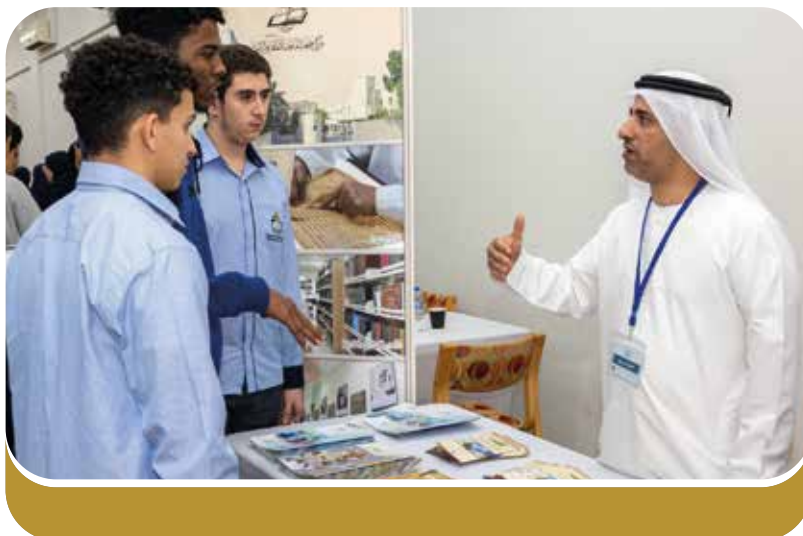
طلاب المدارس يزورون جناح المركز

شارك مركز جمعة الماجد للثقافة والتراث في فعالية "الأبواب المفتوحة" التي نظّمها برنامج علوم المكتبات والمعلومات في جامعة الوصل يوم الأربعاء ١ مايو ٢٠٢٤، بمشاركة عدد من أهم مؤسسات المعلومات في دولة الإمارات العربية المتحدة، وهي: مكتبة محمد بن راشد العامة، والأرشيف والمكتبة الوطنية، وهيئة مكتبات الشارقة، وهيئة الثقافة والفنون بدبي. تضمنت مشاركة المركز تعريفًا بالخدمات التي يقدمها للطلاب والباحثين من خلال مكتبته التي تحتوي على كثير من نواذر الكتب المطبوعة والمخطوطات.