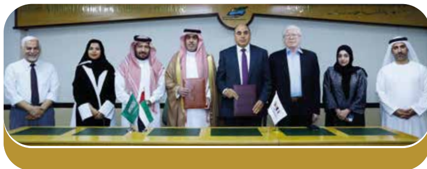
صورة جماعية مع وفد هيئة المكتبات السعودية